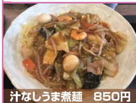
汁なしうま煮麺 850円